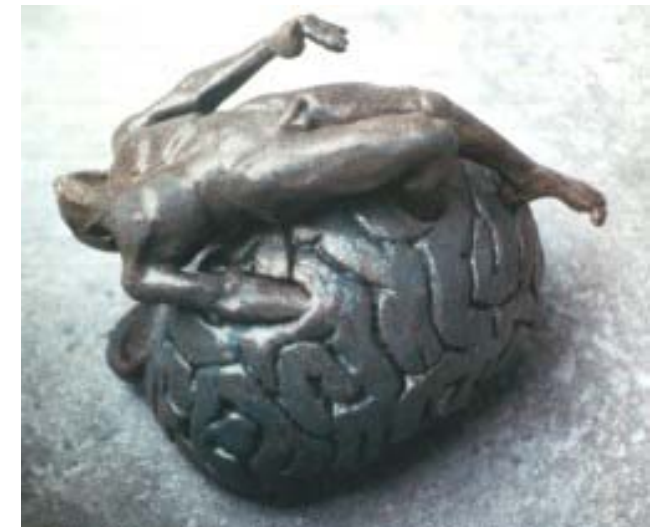
Bodo Wentz: Fallsucht I (Keramik 1983) Deutsches Epilepsiemuseum Kork